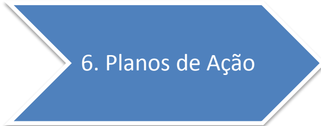
LISTA DE PRIORIZAÇÃO DE TEMAS DA SUSTENTABILIDADE